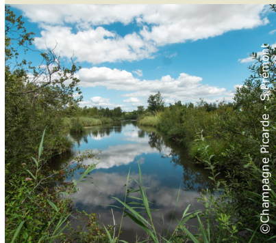
Les marais de la Souche